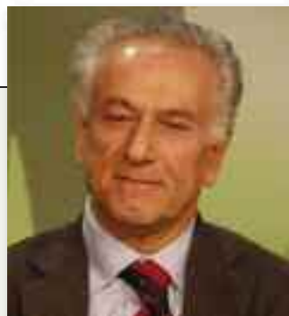
di DOMENICO GRIMALDI

cativo. Le tipologie principali sono l'assistenza domiciliare erogata dai comuni, destinata a supportare i cittadini, in particolare gli anziani nella vita quotidiana e la cura domiciliare che garantisce prevalentemente l'assistenza infermieristica, riabilitativa e quant'altro di strettamente sanitario, riguardante la persona nel proprio domicilio. Nel Nord Europa già si assiste il 10% degli anziani con servizi che prevedono prestazioni integrate sociali e sanitarie, ventiquattro ore al giorno, con l'utilizzo di moderna tecnologia informatica e telematica. Nel Sud Europa la percentuale di anziani assistiti al domicilio è mediamente più bassa 4,4-5%, anche se tutti in linea di massima hanno approvato programmi che prevedono lo sviluppo dell'assistenza domiciliare. In Italia 17 regioni su 21 hanno attivato tale servizio con