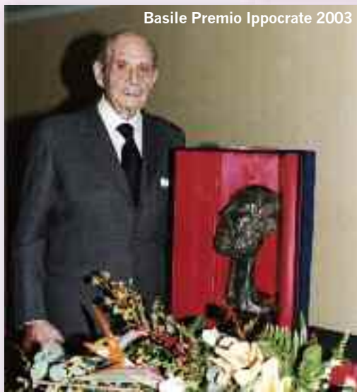
Basile Premio Ippocrate 2003

si conclude e non si concluderà mai! Non è una questione anagrafica e neanche di esperienze. È una lezione di vita che chiunque gli sia vissuto e lavorato accanto, da discepolo prediletto come da studente alle prime armi, non po-