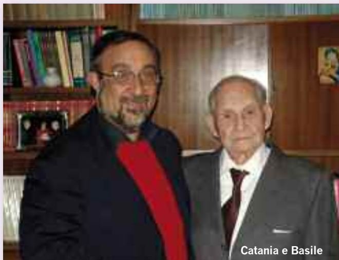
Catania e Basile

direttore responsabile di CATANIA MEDICA