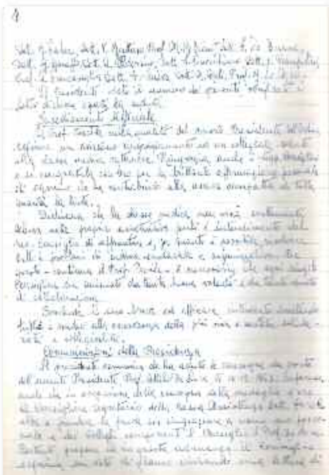
Dal Libro dei verbali del CD dell'Ordine: 10 gennaio 1964. Inse-diamento del nuovo Consiglio e del Presidente.

catanese. Per quella esperienza triennale alla guida dell'Ordine catanese fu accompagnato