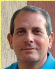
di Giuseppe Donzuso