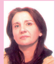
di Antonella Arriva

Designa la parte visibile dalla clientela, e a contatto con questa.