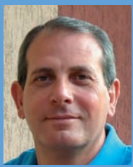
di Giuseppe Donzuso