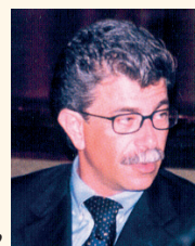
di Alfio Grasso