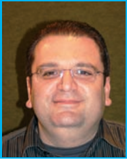
di Carmelo Moschella