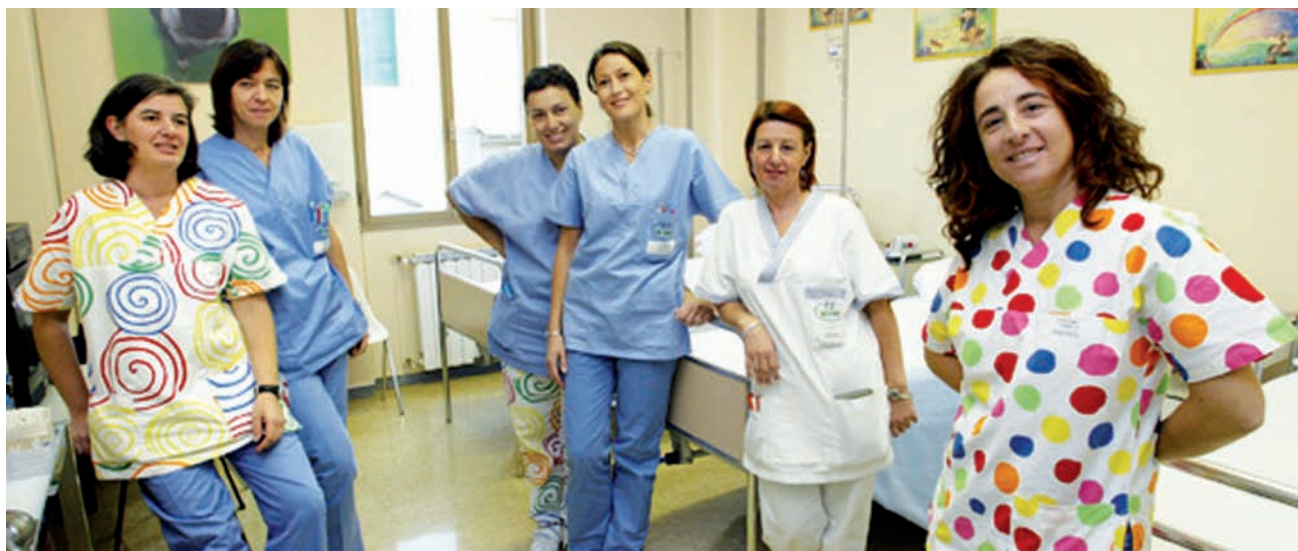
Medici e paramedici dell'Istituti Mayer di Firenze

Dal nostro studio risulta che i bambini hanno percezioni più positive nei confronti degli infermieri che li assistono quando questi indossano uniformi "a misura di bambino" spiegano i ricercatori e, altro dato di particolare rilievo è il fatto che le nuove uniformi non sono state percepite dai genitori come meno professionali ma anzi hanno migliorato la percezione positiva nei loro confronti. Comunque, anche se le nuove uniformi non hanno migliorato significativamente il modo in cui i bambini vedono l'ospedale che li ospita (rimane sempre un luogo di cura e come tale viene percepito), i piccoli degenti si sono sentiti maggiormente a loro agio con gli infermieri "colorati" che li assistevano. Questo è un fattore molto importante in un ospedale pediatrico in quanto migliora sensibilmente la relazione tra i bambini e gli operatori dell'assistenza e di conseguenza aumenta di gran lunga la fiducia verso di essi. Il Meyer è l'unico Ospedale Pediatrico italiano dove da diversi anni gli operatori sono a colori spontaneamente ed hanno scelto di alternare la divisa classica con quella variopinta e visti i risultati positivi della sperimentazione, l'amministrazione ha provveduto ad acquistarne altre mille, garantendo quindi a tutto il personale infermieristico la possibilità di continuare ad indossarle volontariamente.