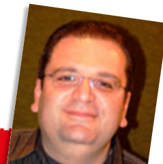
di Carmelo Moschella