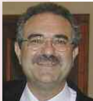
di ANGELO MILAZZO

- Diventa sempre più problematica la trasmissione delle conoscenze tra le coorti