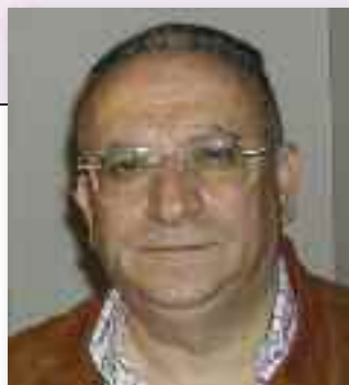
di BIAGIO PAPPOTTO

Vogliamo il coinvolgimento di tutti gli attori del sistema: assessorato alla sanità, organizzazioni sindacali, direttori generali, prefetti, sindaci, ordini dei medici e cittadini.