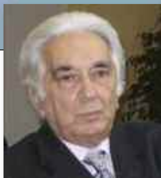
di ANGELO TORRISI

materia. I lavori hanno avuto inizio alle 9 con il saluto delle autorità e con la presentazione del programma da parte dello stesso dott. Erminio Costanzo. Quindi le varie sezioni del convegno la prima delle quali incen-