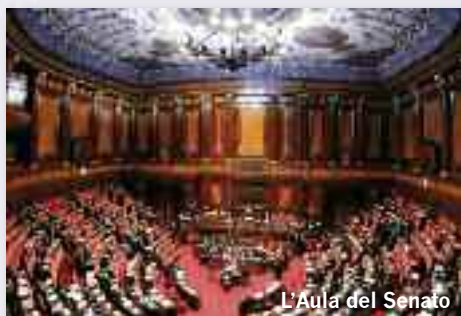
L'Aula del Senato

con entusiasmo l'invito del Presidente Paci, ha partecipato in Perugia per presenziare alla Cerimonia di Inaugurazione dell'Anno Accademico ONAOSI 2009/2010. La manifestazione ha avuto larga