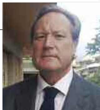
di CLAUDIO TESTUZZA

medico - giornalista pubblicista Esperto Collaboratore de "Il Sole 24 Ore" espertest@libero.it