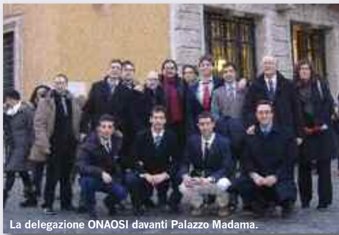
La delegazione ONAOSI davanti Palazzo Madama.

eco ed è stata entusiastica l'accoglienza dei giovani assistiti al Presidente del Senato, che ha pronunciato il suo discorso davanti ad una platea gremita di Autorità Religiose, Militari e Politiche, tra cui, il Capo di Stato Maggiore dell'Esercito, l'Assessore alla Sa-