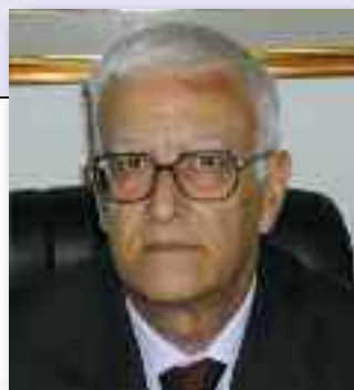
di ERCOLE CIRINO

tinuità Assistenziale, e pubblicato sulla rivista Prospettive Mediche. In questa indagine si rileva che 9 medici su 10 dell'ex Guardia Medica, certamente tra i più esposti al rischio, hanno subito un'aggressione, sebbene nella mag-