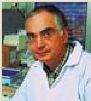
di RENATO BERNARDINI

A seguito dei chiarimenti pervenuti è stato possibile concludere che l'Italia condivide le valutazioni