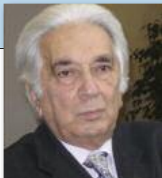
di ANGELO TORRISI