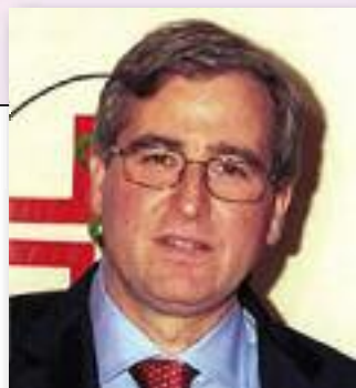
di MAURIZIO BENATO