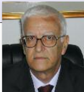
di ERCOLE CIRINO

2) la mole di informazioni presenti sul sanitario sono immense. Da questi due presupposti di-