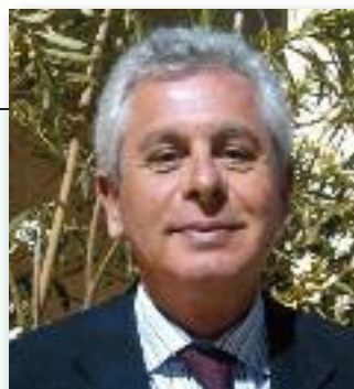
di ANTONIO CIANCI

La RU486 può essere utilizzata come "pillola del giorno dopo": da studi recenti è stato dimostrato che la somministrazione