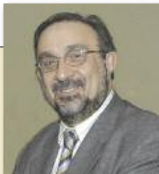
di GAETANO CATANIA

proprio da questo numero e che ci permetterà di analizzare quei temi di cui scrive. Concordo infatti sulla superficialità con cui degli argomenti che necessiterebbero, al contrario, di una precisa conoscenza della materia vengono dibattuti sui giornali o in TV. Si chiama "Focus on..." e ci permetterà di apprendere la verità scientifica accostata alle opinioni, talvolta in contrasto per motivi etici, degli specialisti. E non è un caso se iniziamo parlando di RU 486... Un grazie mi preme inviarlo a tutta la redazione che sta svolgendo un grande lavoro per migliorare ancora CATANIA MEDICA.