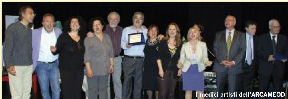
I medici artisti dell'ARCAMEOD

grande solidarietà e di responsabilità sociale, che non costa nulla a chi lo compie, ma può salvare la vita di chi lo riceve. «Nella provincia di