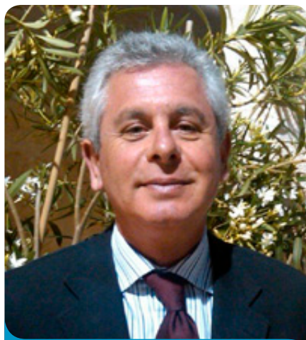
di Antonio Cianci

di continuo non sono infiltrati né edematosi, per cui si procede alla sutura della breccia con punti staccati a doppio strato ed essendo l'emostasi buona e l'utero ben contratto e retratto si soprassiede alla isterectomia totale inizialmente paventata. È evidente che la rottura dell'utero è