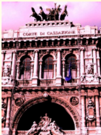
Roma - Il Palazzo della Corte di Cassazione

Infatti, il Supremo Collegio ha confermato, nella fattispecie, la giustezza del provvedimento restrittivo della libertà personale, in quanto non rileva il fatto che la certificazione difficilmente avrebbe potuto avere un contenuto diverso da quello poi realizzato in concreto (trattandosi di persone anziane affette da ipoacusia irreversibile che necessitavano nella maggior parte dei casi di una protesi acustica), ma ciò che concreta la falsità è proprio l'aver il medico attestato falsamente non che il paziente necessitasse di protesi, ma che quest'ultimo era stato visitato e che era stata constatata la sussistenza di un deficit acustico che necessitava di una correzione protesica.